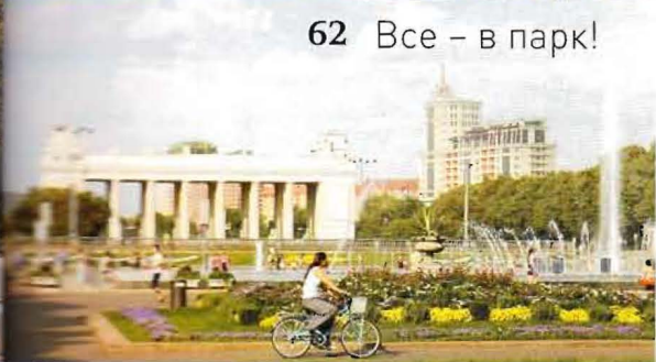
АНДРЕЙ ПЕТРОВСКИЙ / ГОРГОРИО